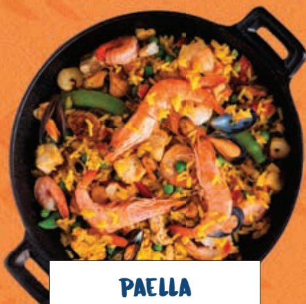
PAELLA AI FRUTTI DI MARE