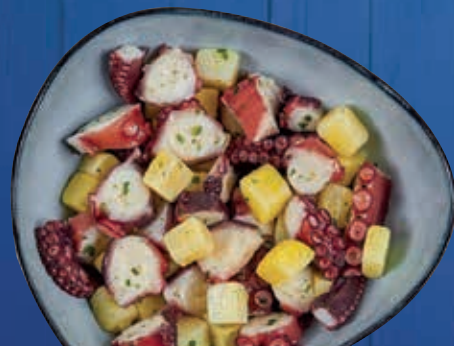
POLPO CON PATATE