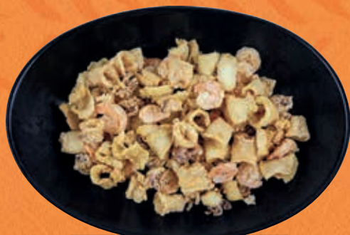
FRITTO DI CALAMARI