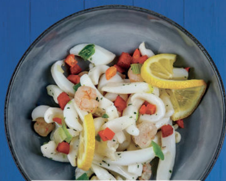
INSALATA DI MARE