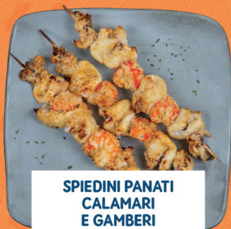
SPIEDINI PANATI CALAMARI E GAMBERI