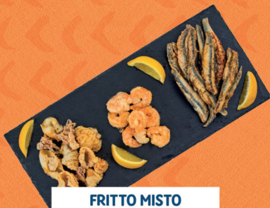
FRITTO MISTO CON ALICI